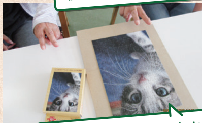
完成まで2カ月かかりました