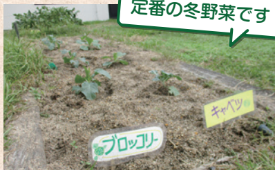
定番の冬野菜です