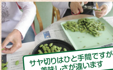
サヤ切りはひと手間ですが 美味しさが違います