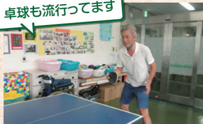
卓球も流行ってます