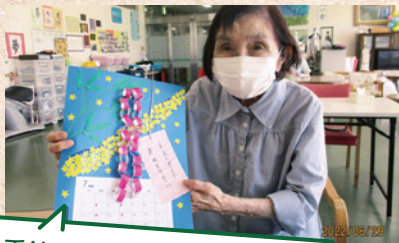
季節にちなんだデザインです