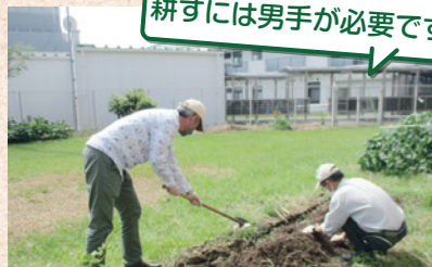
耕すには男手が必要です